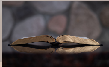
Normativa Grupos de Innovación